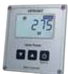
Art.-Nr. 1250 LCD-Solar-Computer S